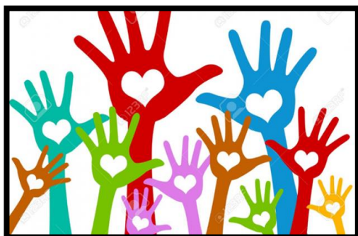
Leden & Vrijwilligers